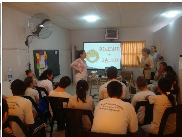
Charla dictada en Escuela de Formación Especial