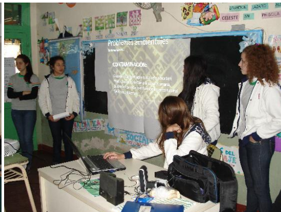
Charlas dictadas por Comisión Ecológica Zuviria en Escuela Nro.611 La Lola, Comunidad Aborigen