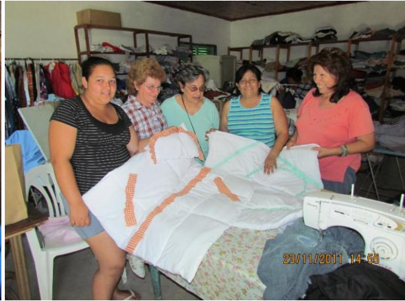
Costurero Comunitario Barrio Ombusal