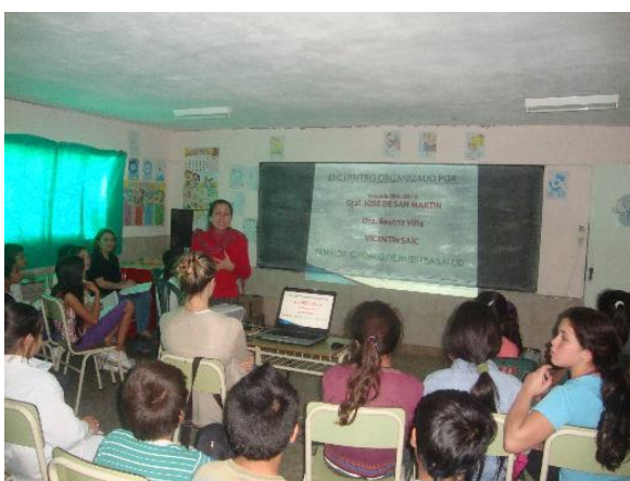
Charla dictada en Escuela Nro. 0010 San Martín. "Hogar de la Esperanza"

Esta propuesta fue recibida por diversas instituciones educativas adoptándose la modalidad de capacitar a un grupo específico de alumnos que posteriormente actúan como promotores en la misma institución transmitiendo los conocimientos adquiridos. Los temas que se desarrollan de forma integral son HIGIENE PERSONAL, HIGIENE ALIMENTICIA e HIGIENE EN EL HOGAR.