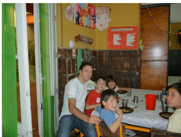
Visita a Centro de Acción Familiar

Los empleados que voluntariamente cumplen el rol de “Padrinos” efectúan visitas periódicas a las instituciones involucradas y constituyen el nexo entre institución y empresa.