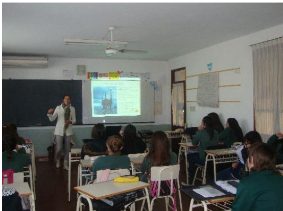
Talleres dictados en Instituto GMZ sobre “Calentamiento Global”

Este programa nuclea actividades de acompañamiento a Campañas Ecológicas , organización de Talleres y Charlas de información y concientización destinadas a las escuelas, con el propósito de promover conductas ambientales positivas.