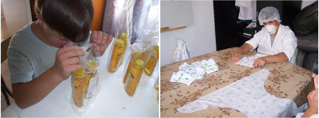
Alumnos realizando actividades manuales de ‘Plegado de pañalin’ y ‘Fraccionado de productos’.