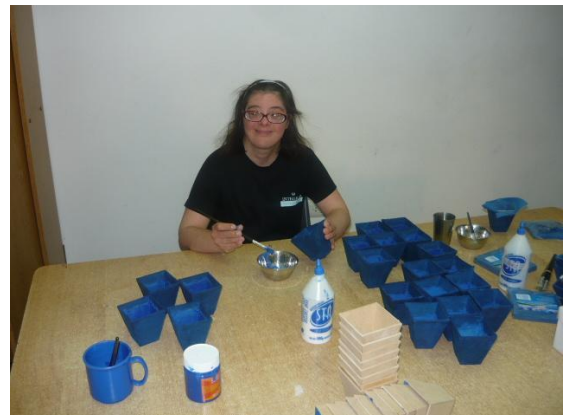
Elaboración de presentes Día de la Madre, Centro de Capacitación Laboral INTEGRAR