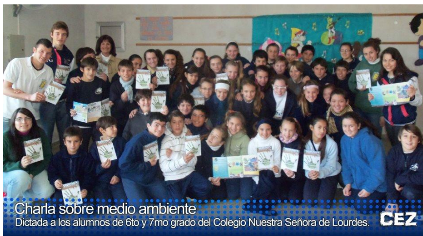
Charla sobre medio ambiente Dictada a los alumnos de 6to y 7mo grado del Colegio Nuestra Señora de Lourdes.