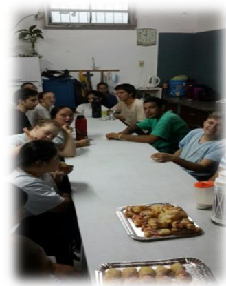
Alumnos realizando la actividad de Recupero de Algodón