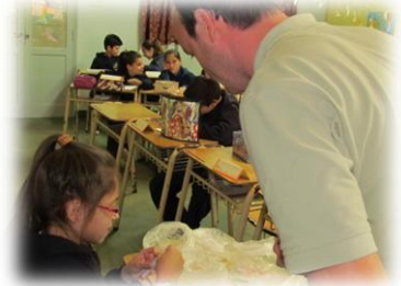
Programa J K5 Nuestra Nación – Colegio Nstra. Señora de Lourdes Y Dante Alighieri