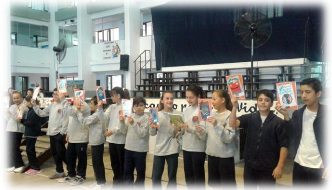
Premiación Concurso de Arte Ambiental Infantil