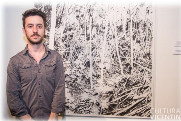
Apertura y Premiación Salón de Pintura y Concursos Literarios Vicentin